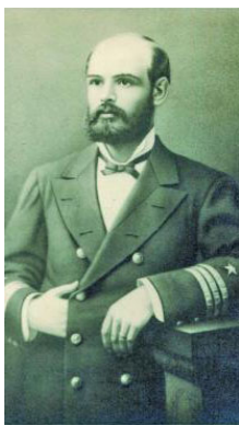
31 AÑOS TENÍA EL CAPITÁN PRAT AL MOMENTO DE SU DECESO.

El sacrificio de Arturo Prat y sus hombres en Iquique, el 21 de mayo de 1879, se convirtió en un hecho que impresionó a la ciudadanía de la entonces joven república chilena, marcando el derrotero de la Guerra del Pacífico