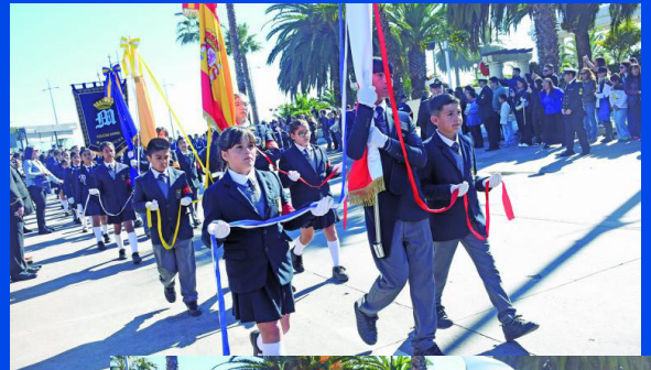
Viña del Mar